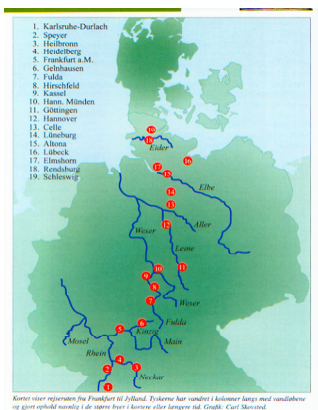
Ruten fra Sydtyskland til Slesvig