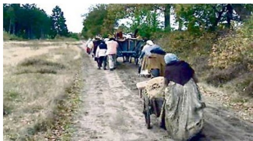
Trækket mod nord